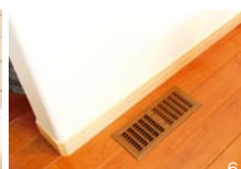
6.給気口からは夏ひんやり、冬あたたかな空気。春先は花粉対策にも

アパート(2DK) ガス・電気・灯油代 ¥151,186/年 現在(3LDK+収納部屋) 電気代のみ(オール電化なので) ¥115,126/年