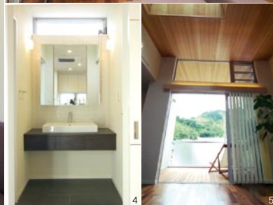
1. 木製自動扉のビルトインガレージは収納でも大活躍 2. 上吊り透明アクリル扉でLDKと階段ホールを開仕切るアイデアで、冷暖房効率をUPさせながら遠くまで視線を繋げて 3. 5. リビングの勾配天井はタモ、床はウォールナット。外部のウッドテラスまでこの天井・床のデザインを連続してコーディネートすることで広がり一体感が感じられる 4. ホテルライクな洗面スペース