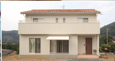
1. 高さ約5.5mの吹き抜けリビング。カラフルなガラスブロックと照明器具がアクセントに 2. ボップなアメリカン雑貨がオープンキッチンを楽しみ演出。キッチンから子どもの気配が常にかかるように、家全体を開放的な間取りに 3. 焼き色がキレイな南欧風のS字瓦。広いベランダには家族全員の布団が一度に干せる 4. 下に収納棚を設けた小上がりの畳スペースは何かと便利 5. 愛犬を手入れするためのインナーテラス。ここで汚れを落とせるので、室内はいつも清潔 6. 小物を飾るスペースを大工さんに造ってもらい、楽しい空間に 7. 奥様が趣味で集めた雑貨をインナーテラスに 8. 2階の子ども部屋は間仕切り可能。壁の色を静(グリーン)と動(ピンク)に分けているのがステキ。自慢の個室ができて、長女も大喜び!

●設計/戸田哲行 ●施工/マル祐戸田建築 ●延床面積/130.01㎡ ●敷地面積/331.49㎡ ●坪単価34万円～ ●構造/工法/木造軸組工法 ●間取り/4LDK ●施工期間/6ヶ月